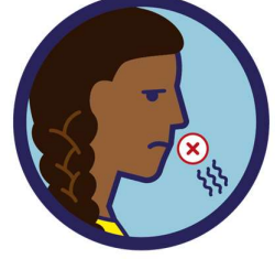
سونگھنے میں بے حسی