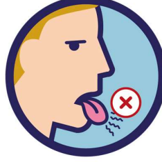
ذائقہ میں بے حسی