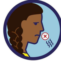
لا رائحة له